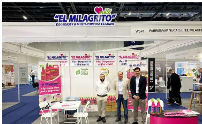
Feria White Label World Expo London en Londres 2025.

de nuestro producto, sino también la esencia, los valores y el esfuerzo que hay detrás de la empresa.