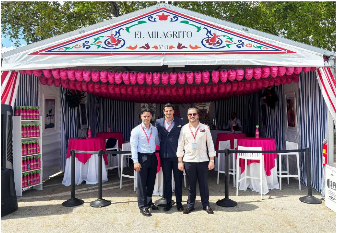
Feria de Sevilla en Miami 2026.