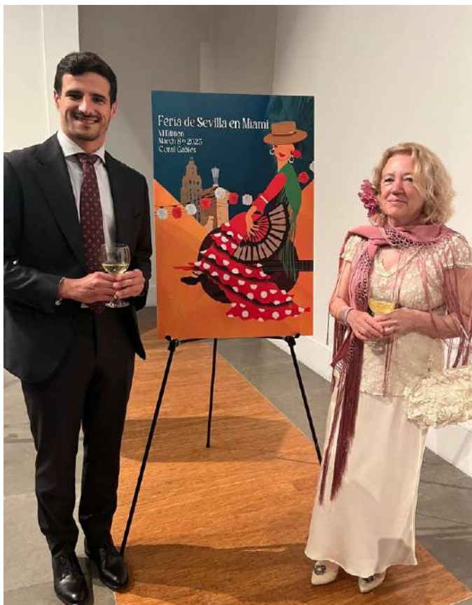
Feria de Sevilla en Miami 2025.

“La feria que más me ha sorprendido es la de Miami: tienen una cultura muy similar y nuestra botella rosa les encaja muy bien”