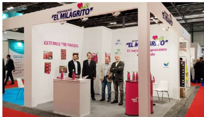
Feria Privel en Madrid 2025.

Para mí, representar a El Milagrito en escenarios internacionales tan diversos significa una gran responsabilidad y también un gran orgullo. Es la oportunidad de mostrar no solo la calidad